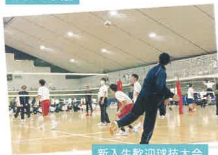
新入生歓迎球技大会