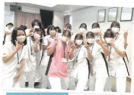
ふれあい看護体験