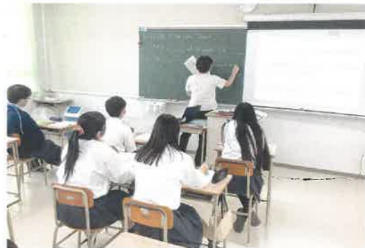
英語コミュニケーションⅢ