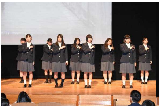
授業発表*福祉(手話ソング)