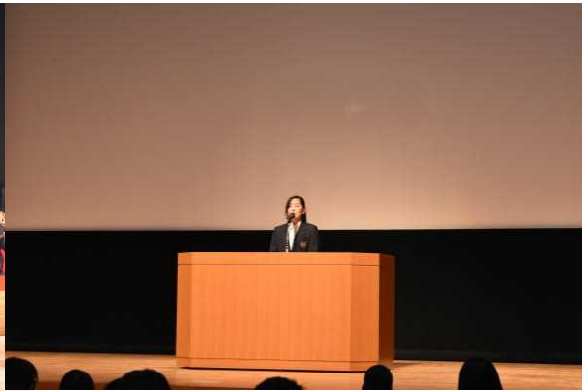
3年生英語スピーチコンテスト発表