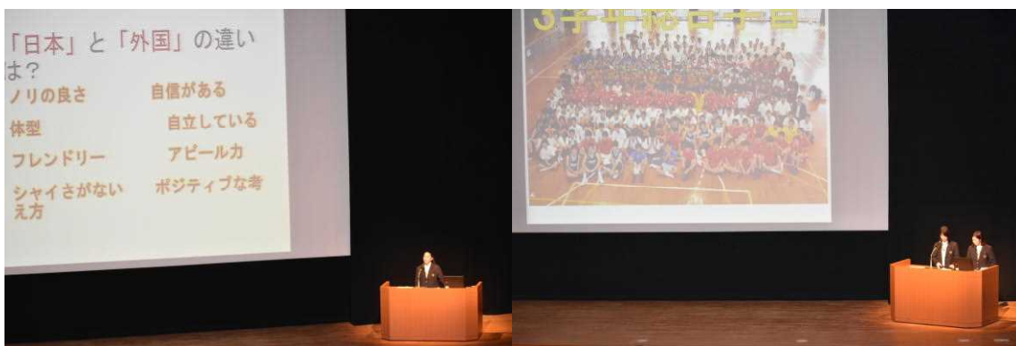
3年総合学習：課題研究発表