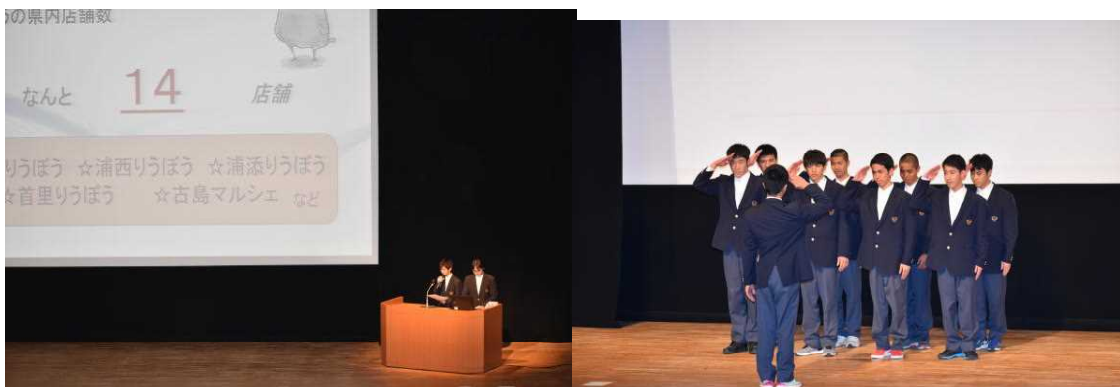
2年インターンシップ報告・実践