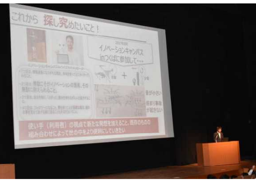
琉大 AO 入試プレゼンテーション