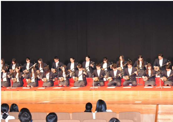
二・三年授業発表(郷土の音楽)