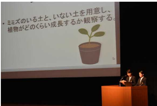
授業実践発表(理科)