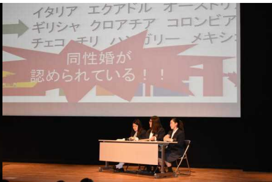
授業実践発表:福祉(LGBTQについて)